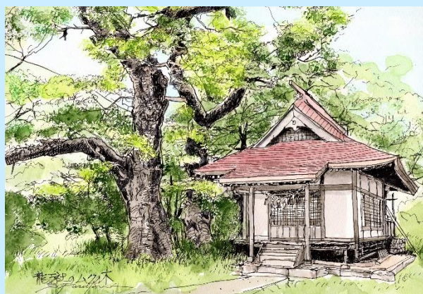
【石州街道 龍王社ムクノキ】